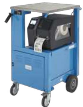
Motorbetriebener mobiler PrintCart