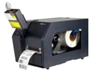
Online Barcode Validierung (ODV)